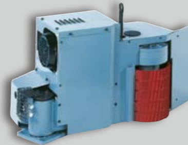
Mod. SR 036

Squadro a rulli Roller fence Equerre a rouleaux Rollenanschlag Esquadro a rodillos